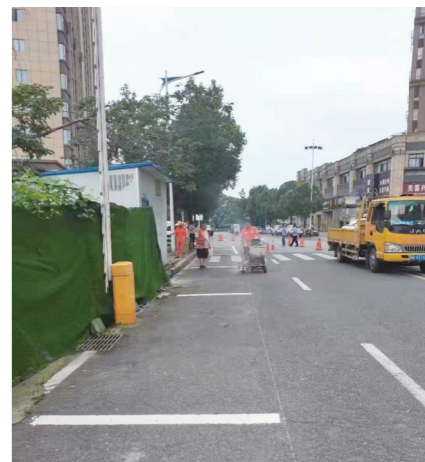
▲翰林街道双洲路,工作人员正在施划停车位。

本报讯(株洲晚报融媒体中心记者/李逸峰 通讯员/甘敏 张华)株洲经开区云田镇云田老街,一直是辖区违停现象较严重区域之一。因老街是双车道,未规划停车位,周边也无停车场,老街上宾馆、饭店、商铺较多,前来购物、用餐、办事的居民无处停车,十分不便。车辆无序停放,影响市容市貌。针对这一现象,该区城管局、云龙交警大队多次实地调查走访,根据停车供需状况、周边道路条件和交通流量等实际情况,坚持因地制宜,规范施划停车位。6月13日至15日,区城管局、云龙交警大队联合云田镇、龙头铺街道、翰林街道,出动40余人,在辖区云田镇老街、龙头铺新街以及翰林街道双洲路、湖湘路、崇德路开展停车位划线行动,新施划停车位269个,切实缓解群众停车难题,营造文明有序的出行环境。下一步,该区还将对云田镇茶马线