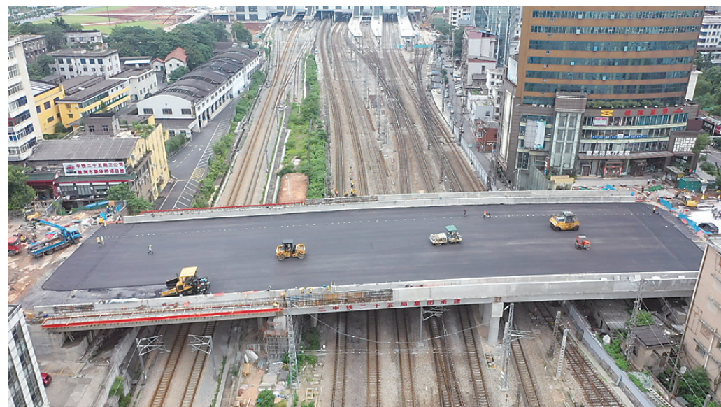
▲16日上午，新华桥完成第一层沥青铺装。

本报讯(株洲晚报融媒体中心/廖明)根据相关计划，新华桥拆除重建工程，将于6月20日达到通车条件，目前进度如何？