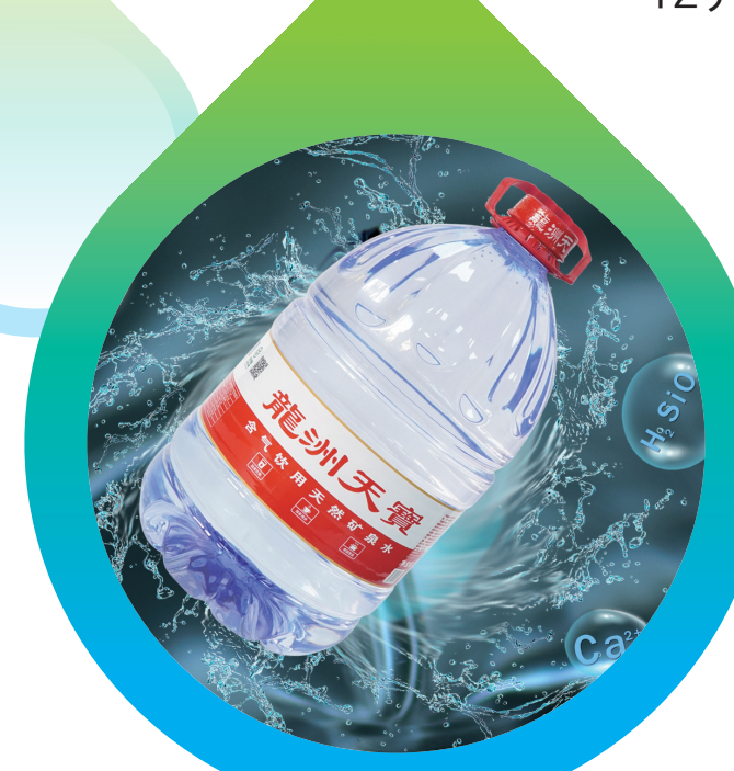
▲12升矿泉水深受年轻人喜爱。