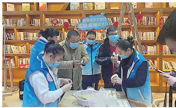
天元区新时代文明实践站内，正在举办居民喜闻乐见的活动。

株洲日报讯（全媒体记者/谭昕吾 通讯员/陈灿华）自开展创文工作以来，天元区充分发挥新时代文明实践中心及下辖街道、社区的新时代文明实践所、站功能，千千万万名新社区志愿者携手奉献，有针对性地开展志愿服务，有效提升志愿服务质量，打通宣传群众、教育群众、关心群众、服务群众“最后一公里”。