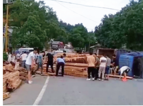
▲散落木方堆满路面。

恢复。随后民警叮嘱货车司机,驾车时一定要谨慎驾驶避免事故发生。司机对民警和群众的及时救助表示感谢。