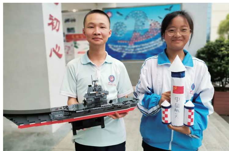
▲孩子们根据自己的兴趣，制作了能“上天”“入海”的各类模型。

近日，景弘中学初二历史组遵循双减政策的规定，布置了一项别开生面的作业：利用假期，了解教材中关于国防建设、科技成就的相关内容，动手制作具有代表性成就的模型或绘制手抄报及绘画作品。