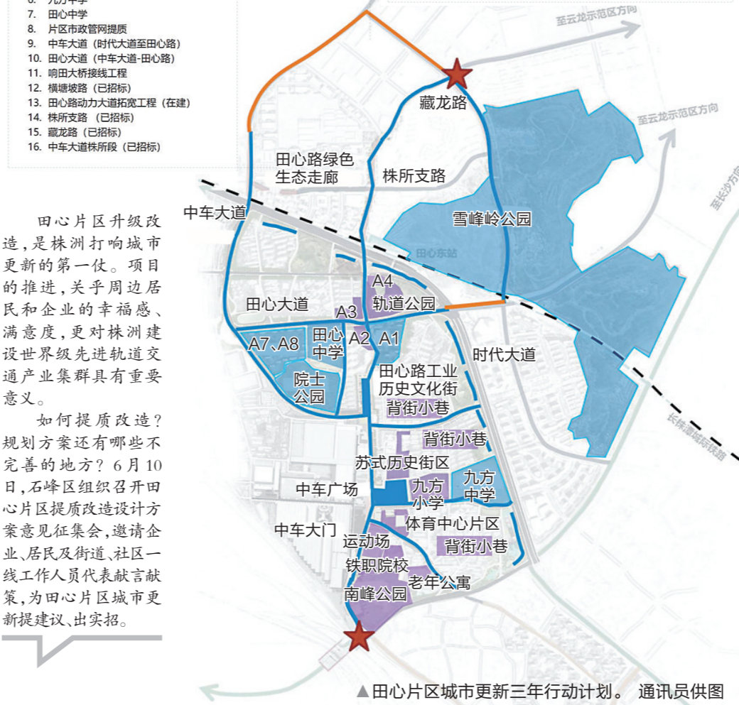
▲田心片区城市更新三年行动计划。