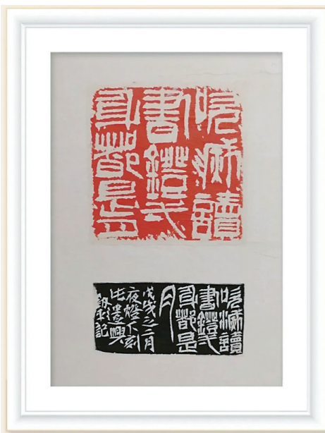
▲叶剑平的《篆刻:吹灭读书灯一身都是月》