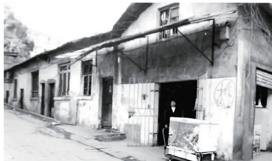
▲株洲首家国营粮店——西街粮店(资料图)。