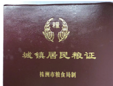
▲仇民主收藏的城镇居民粮证。