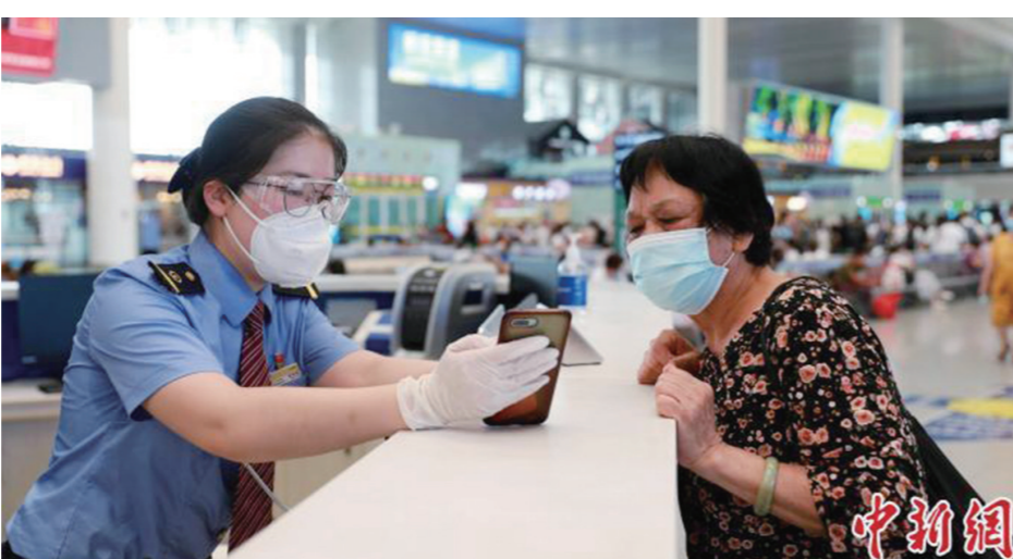
资料图:南宁东站工作人员帮助老年旅客查看购票信息。

近期,国务院联防联控机制发布会已多次强调了严禁防疫政策层层加码、一刀切。国家卫健委相关负责人在6月5日的发布会上还明确提出“九不准”,包括“不准随意将限制出行的范围由中、高风险地区扩