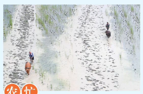
农忙 6月6日,在贵州省榕江县寨蒿镇平堡村,村民用耕牛翻耕稻田。 当日是芒种节气,各地农民抢农时、忙耕作,田间地头呈现一派忙碌景象。