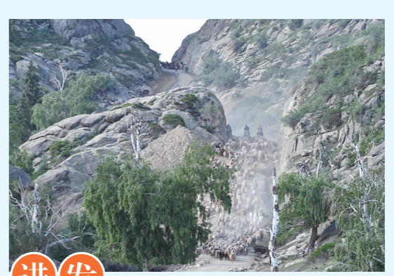
进发 6月5日,在新疆阿勒泰地区福海县沙尔布拉克春秋牧场转往夏季牧场的牧道上,牧民赶着牲畜向夏季牧场进发。