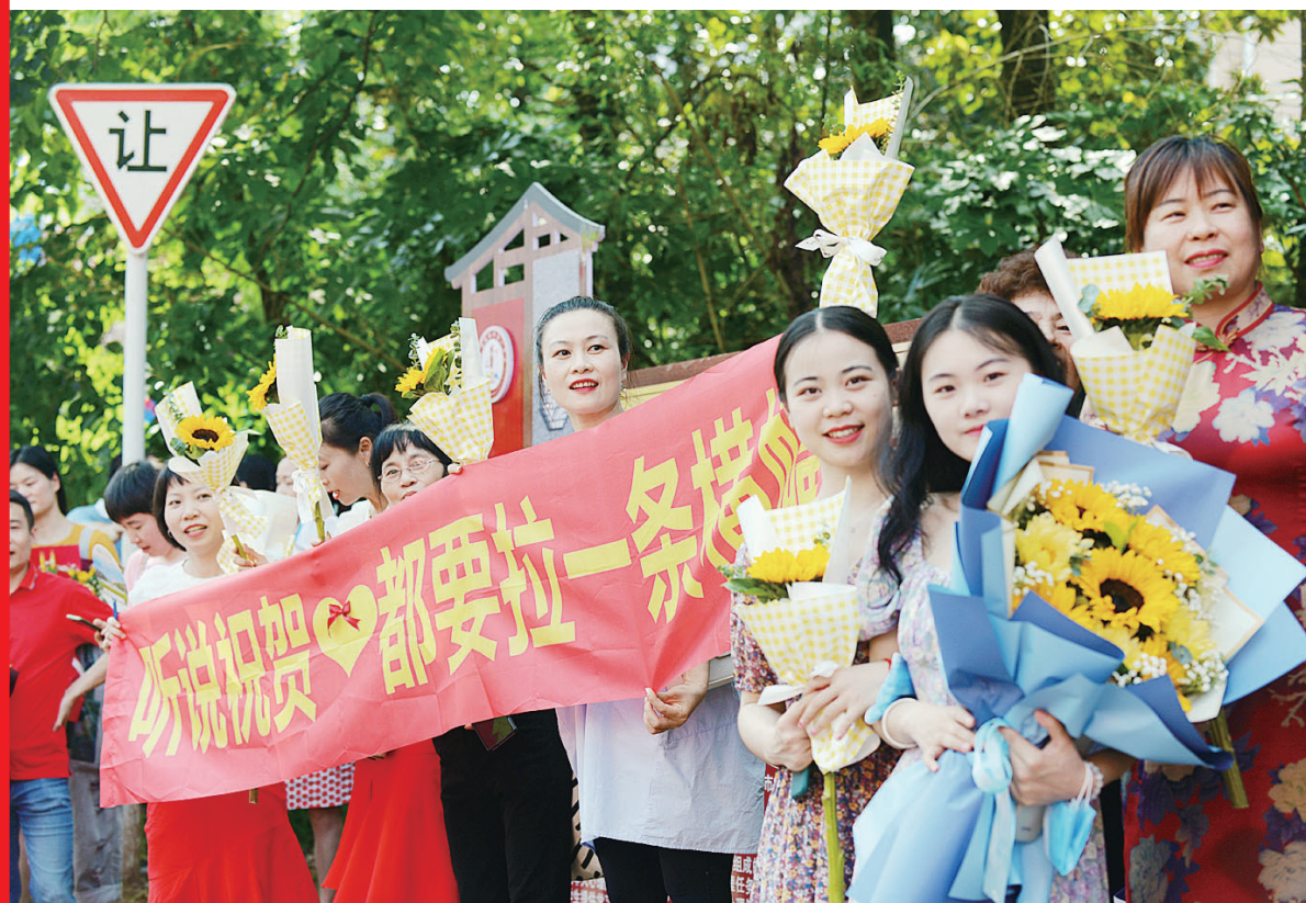
“妈妈助威团”在考点外拉起了横幅,手捧鲜花,等候考生走出考场。

株洲日报讯(全媒体记者/戴源 通讯员/郑奕) 昨日18时15分,随着考试终铃声响起,2022年高考结束。高考三天来,全市18个考点各项考务工作平稳有序,秩序良好。