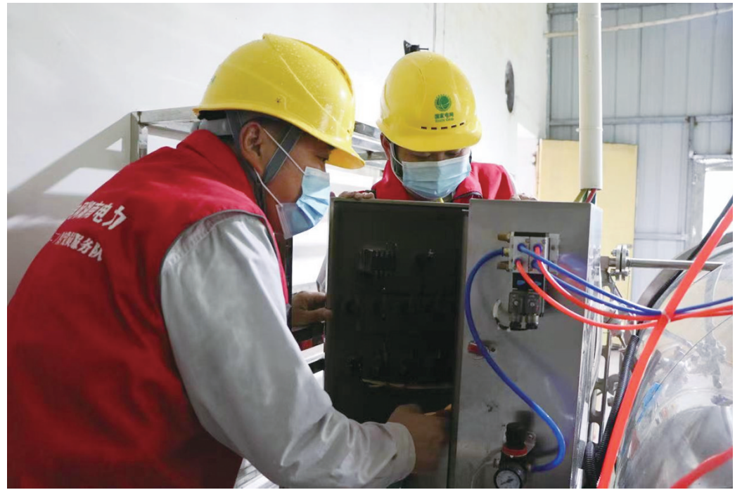
电力工作人员帮助食品厂改造电力线路。

据了解,目前该区139个村(社区)均设立了“村电共治”便民服务点,有序推进实施70余个需要电力支持的乡村产业项目,为乡村振兴解围、赋能。