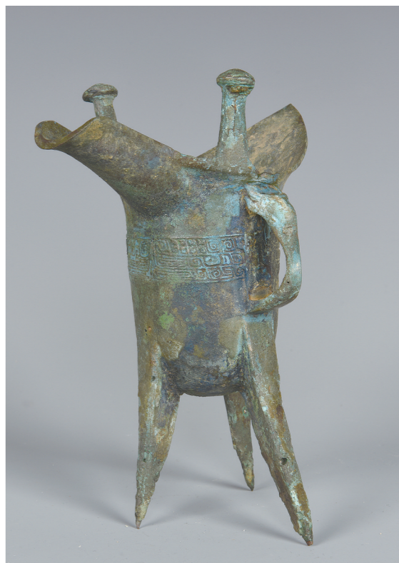
文物名：父乙铜爵 年代：商晚期 出土年代：1990年 出土地点：株洲南阳桥 规制：通高18.5cm、柱高3.8cm、流长4cm、尾长2cm 馆藏地：株洲市博物馆