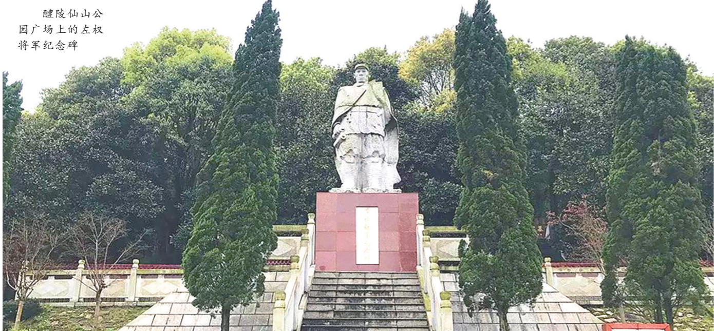
醴陵仙山公园广场上的左权将军纪念碑