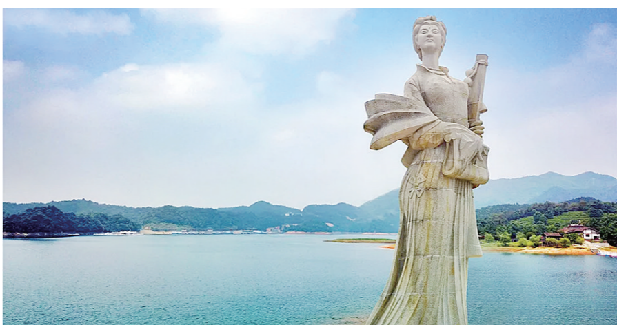
酒仙湖畔依女塑像

这样漫山遍野的油桐花，我还是第一次看到。 头天晚上，下了第一场夏雨。雨的湿润和清凉，全都弥漫在酒埠江的群山溪流、峡谷与湖泊上。车子刚旋上山巅，一片如雪花般蓬松柔软的油桐花就映入眼帘，在早晨明丽的阳光映照下格外耀眼。一车人都惊了起来。 车停在酒仙湖畔，很奇怪，大家并不在意眼前的酒仙湖，而是匆匆走向绕湖的步行曲径，去近距离观看着浮在绿叶上盛开的油桐花。因为昨夜风雨的缘故，曲径上已铺满了从枝头落下的油桐花。那白如雪的花，由五朵白色的花瓣组成，花蕊则纤细如针，呈红黄色点缀其中。细数落花，品其姿、其色、其状，我闻到了一股清甜的清香，心情变得凄然。我不忍心看着有的游人，躏踏它的灵秀，无限痛惜地离去。