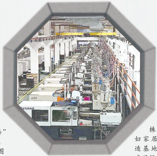
株洲好媳妇家居智能制造基地车间生产现场。