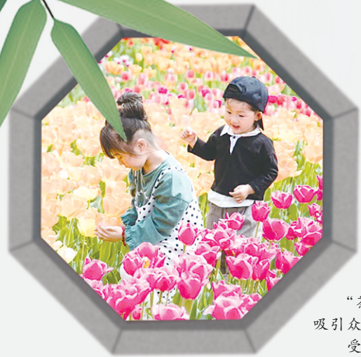
“茶乡花海”吸引众多游客。