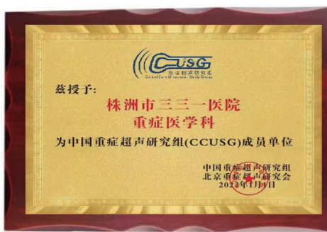
▲市三三一医院重症医学科成功入选中国第一批重症超声研究组(CCUSG)成员单位。

此次入选CCUSG成员单位是科室长期努力的结果,其将以此为契机,更好地开展重症超声等方面的研究及应用,不断提升重症患者救治水平,助力株洲市三三一医院“三甲医院”的创建工作,推动医院高质量发展。