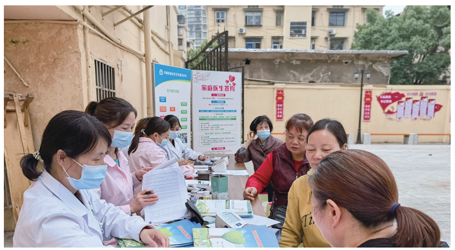
家庭医生团队为社区居民进行义诊。

株洲日报讯(全媒体记者/向胤蓉 通讯员/冯书琴 陈怡 刘春香) 今年5月19日为第12个世界家庭医生日。荷塘区卫生健康局组织辖区基层医疗机构开展相关宣传活动,提高居民对家庭医生的知晓度。