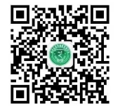
关注“株洲市营养师健康管理协会”微信公众号参与答题。

除了每天1000个现金红包外,活动还将按个人成绩排名,每日的前三名可分别获得100元、50元、30元奖励。活动结束后,按照答题成绩总排名,第1名至第10名将获得价值1094元的拜妥优特殊医学用途全营养配方食品两盒及拜洛平乳清蛋白粉一盒,第11名至第30名将获得价值696元的拜妥优特殊医学用途全营养配方食品一盒及拜洛平乳清蛋白粉一盒,第31名至第60名将获得价值398元的拜妥优特殊医学用途全营养配方食品1盒。