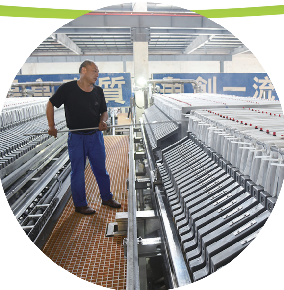
兴隆新材白炭黑二车间压滤工序智能化生产线。

株洲日报全媒体记者/李逸峰 通讯员/李琼琦 撰流“生产用户满意的产品,创建一流企业”……在兴隆新材,类似的宣传标语随处可见,折射出企业对产品质量的孜孜追求。