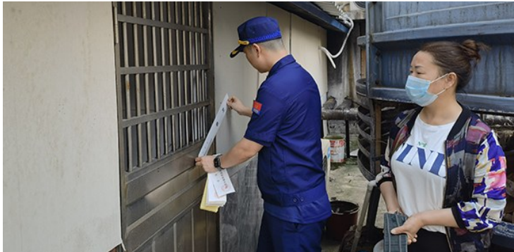
执法人员依法查封宾馆员工宿舍。