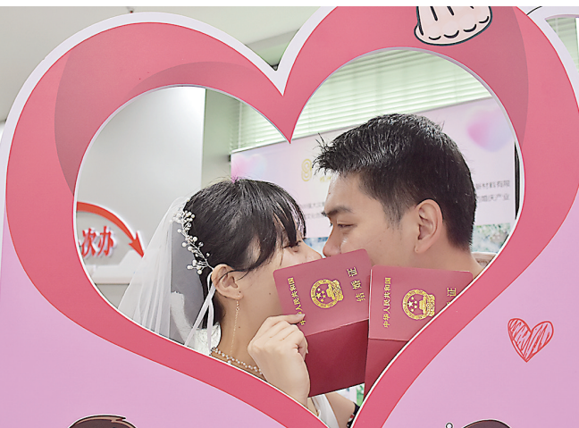
“520”告白日的爱情见证。

准新娘梁女士一脸幸福地说,为了有仪式感,她还提早穿上婚纱,选择“520”这个日子,是因为好记又有特殊意义。“我们提前一个月就在网上预约了今天登记结婚。” 市民政局相关负责人表示,特殊日子婚姻登记处会采取提早上班、中午不休、延时下班的情况应对领证高峰。