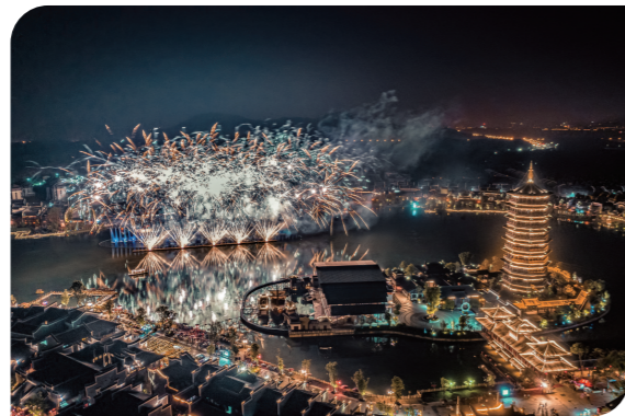
▲铜官窑夜景

境内旅游资源类型丰富,拥有世界上面积最大的野生云锦杜鹃花林、湖南省最大的高山湿地、湖南省自然落差最高的瀑布、湖南省最早发现的冷杉群落、湖南省最高的高山茶园等特色资源。景区内森林覆盖率达96.6%,负氧离子浓度高,有“亚洲第一氧吧”之美誉。境内野生动植物物种多样,重点保护植物种类繁多。