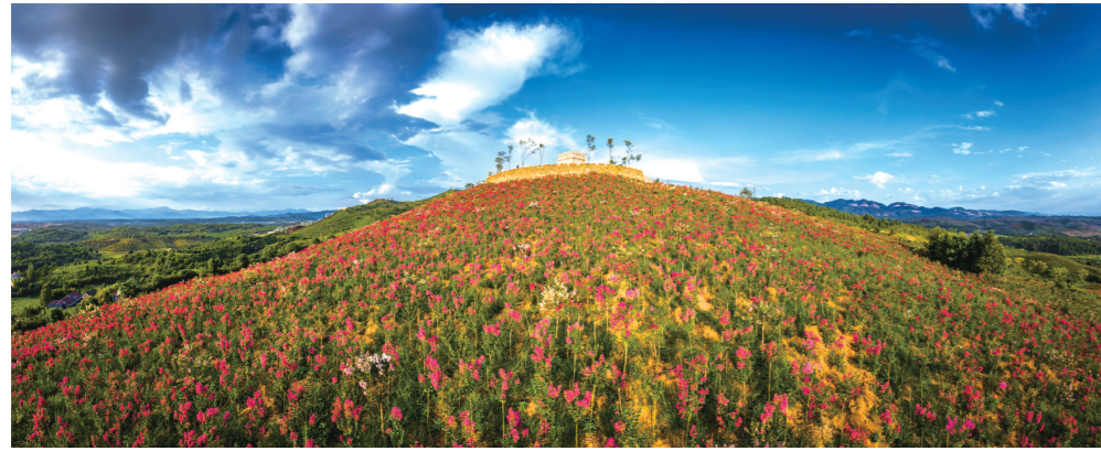
▲中国花湖谷

对于很多不喜欢炎热天气的人来讲,想要度过夏天简直是难上加难。但是这时候可以选择一些比较凉爽的地方,接下来就带着大家一起看一看在这个夏天适合去哪些地方?