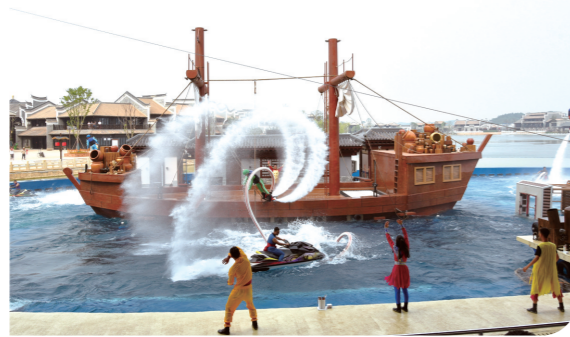
▲铜官窑黑石

神农谷境内有甲水、桃花溪、横泥山、九曲水、平坑、田心里6大景区40多个主要景点。其中有空气负氧离子含量高达136426个/立方厘米的“亚洲第一氧吧”——珠帘瀑布;有我国南方地区保存完好的一块11.6万亩的原始森林;有海拔2115.2米的湖南屋脊——神农峰(原名翻峰);还有落差235.2米的湖南第一高瀑——神农飞瀑。神农谷每年接待境内外游客近百万人次,游客旅游旺季一般在七八月份,季节性较强,已逐渐成为全国知名旅游胜地。园内主要有在海拔1300米的山上珍稀树种银杉群落,位于海拔1350—1580米的中山地带的大院冷杉群落、南方红豆杉群落,是游客休闲康养、网红打卡的好去处。