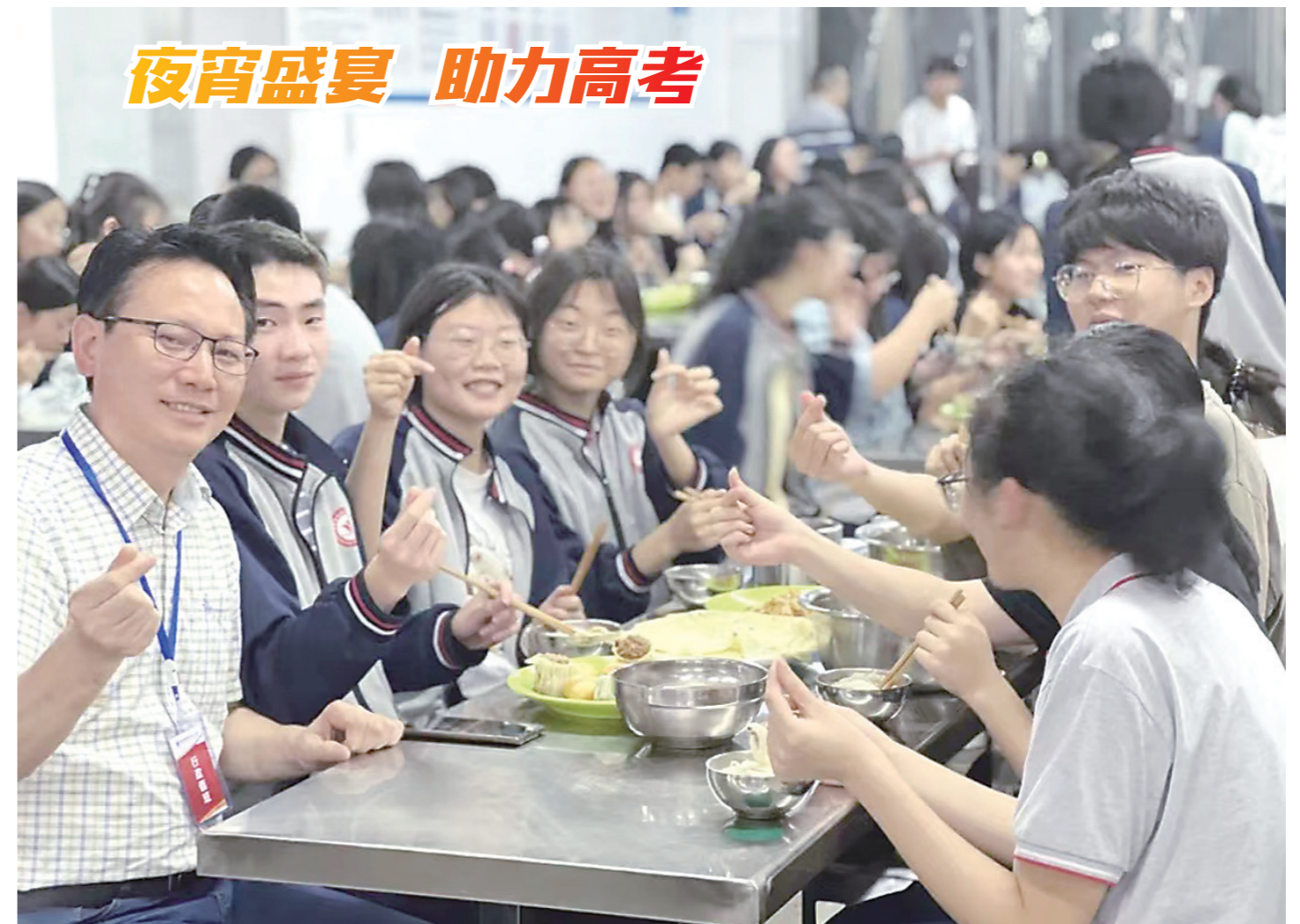
▲临近高考,为了给高三学生全力备战补充能量,近日市十三中为考生们提供了一场别有滋味的夜宵盛宴。夜宵品类有牛肉水饺、寓意牛气冲天;有红豆粥,寓意红红火火;有葱油饼、小馒头、烧卖寓意聪明智慧、蒸蒸日上、花开富贵。图为晚自习课间休息时间,高三的孩子进入食堂开心地享用美食,扫去一天的紧张与疲惫。