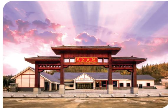
▲云上大院景区大门

位于茶陵县严塘镇境内,是茶陵县实施“全域旅游”和乡村振兴战略的品牌项目,大花海景区建设,大花海景区规划面积11.6万亩。目前,已建成紫薇园、丹桂园、杜鹃园、红枫园、玉兰园、樱花园、黄桃园、蜜桃园、油茶园、樟树林、无患子林、石楠林等10余个特色精品园。建设游道69公里,景观大道23公里。建有漂亮的游客接待中心、紫薇大酒店、丹桂轩山庄,宽阔的驿站、停车场,新颖别致的景观休闲亭、观景台,壮观的瀑布群、莲花池、垂钓中心、阳光活动草坪等。