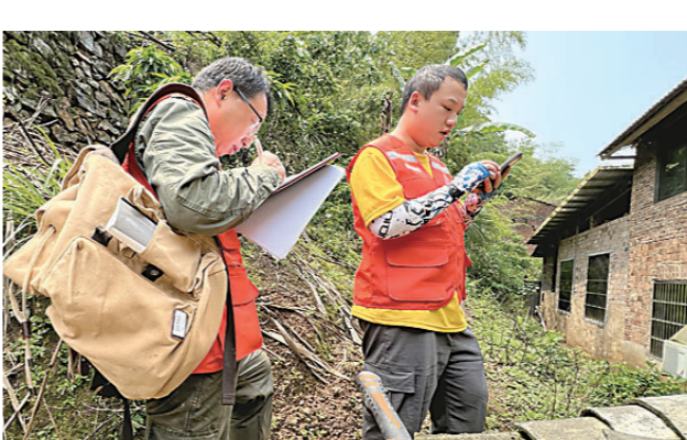
▲每个斜坡单元的数据核查必须准确无误。