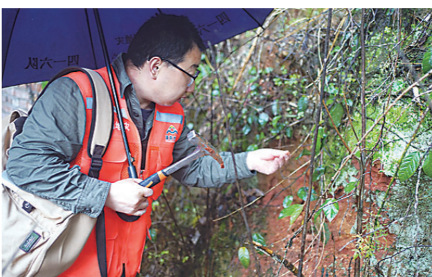
▲有青苔脱落的地方，调查队员都要仔细排查。