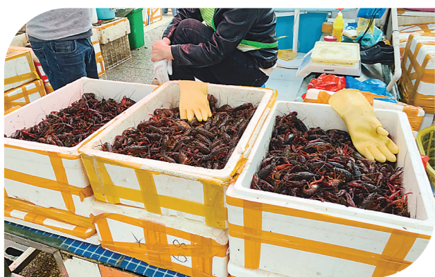
▲市场里待售的小龙虾摆在最显眼的位置。