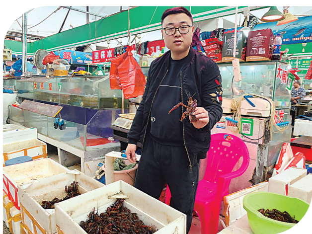
▲彭老板向记者展示小龙虾的品质。刘芳 摄

近日，“小龙虾跌到个位数！”的消息刷屏了吃货们的朋友圈，让不少人感叹“吃虾自由”来了吗？5月，进入小龙虾消费旺季，株洲小龙虾市场行情如何？价格还会有下调吗？近日，记者对此进行了走访。