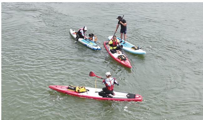
▲桨板爱好者在湘江划板。

自3年前,“木匠”在江边玩桨板以来,株洲玩桨板的“弄潮儿”从1人到了10人,再到如今的30多人。只要天气好,下班后,大家就会相约湘江边,过一把乘风破浪的瘾。