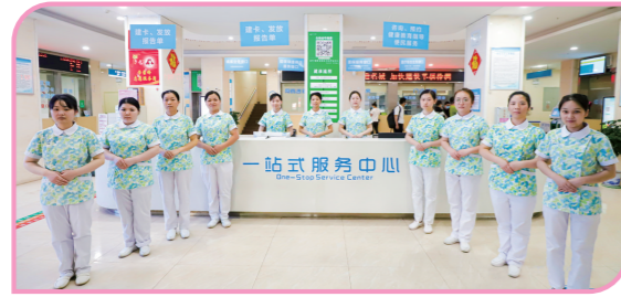
▲门诊部护理团队。

市妇幼保健院服务的主要人群是我市及周边地区的妇女儿童。要问带着孩子看病的妈妈亦或是挺着大肚子产检的孕妇去医院时最怕什么，答案多是环节繁琐、等待太久。