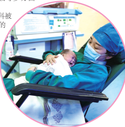
▲产妇走进NICU，和宝宝亲密接触。通讯员 供图