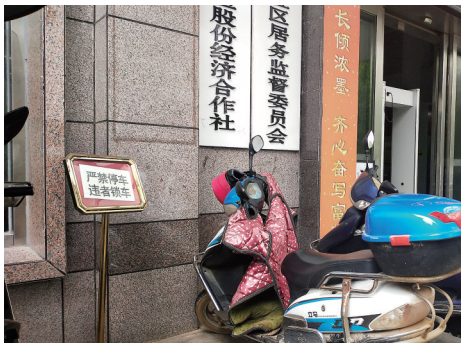
▲高塘社区大门口摩托车乱停,边上还有“严禁停车”的告示牌。

不能马上落实的5个工作日内整改到位。同时,要求社区开展自查自纠行动,主动发现问题,及时改进。