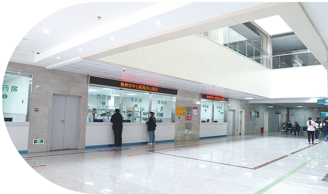
田心院区门诊内环境图

验”,在田心居民看来,提质改造后的田心院区有何变化?和之前相比,如今的田心院区在服务质量、服务能力、服务范围等方面又有哪些不同?本期健康周刊,我们走进田心院区。