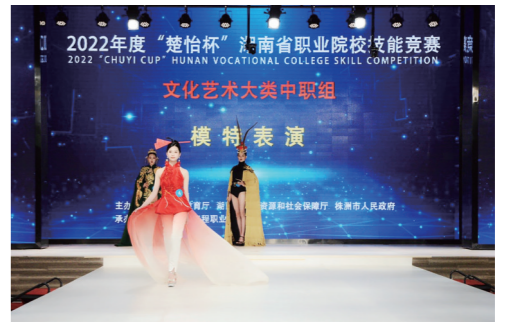
▲选手进行现场表演。

本报讯(株洲晚报融媒体记者/戴凛 通讯员/彭新华 王海波)日前,2022年湖南省职业院校技能大赛(第二阶段)中职组模特表演赛项,在湖南汽车工程职业学院圆满落幕。来自全省各市州41支代表队的70名优秀选手同台竞技、展现才艺。