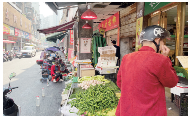
▶芦淞区沿江路,临街商铺存在占道摆摊现象。

本报讯(株洲晚报融媒体记者/伍靖雯)建筑施工未采取降尘措施、“亮点工作”成了“花果架”……5月3日,市城管局创文工作芦淞区督查组以突击暗访形式,对贺嘉路、沿江路、芦淞路等创文整改重点地段进行督查,市容环境卫生“脏乱差”等问题严重。