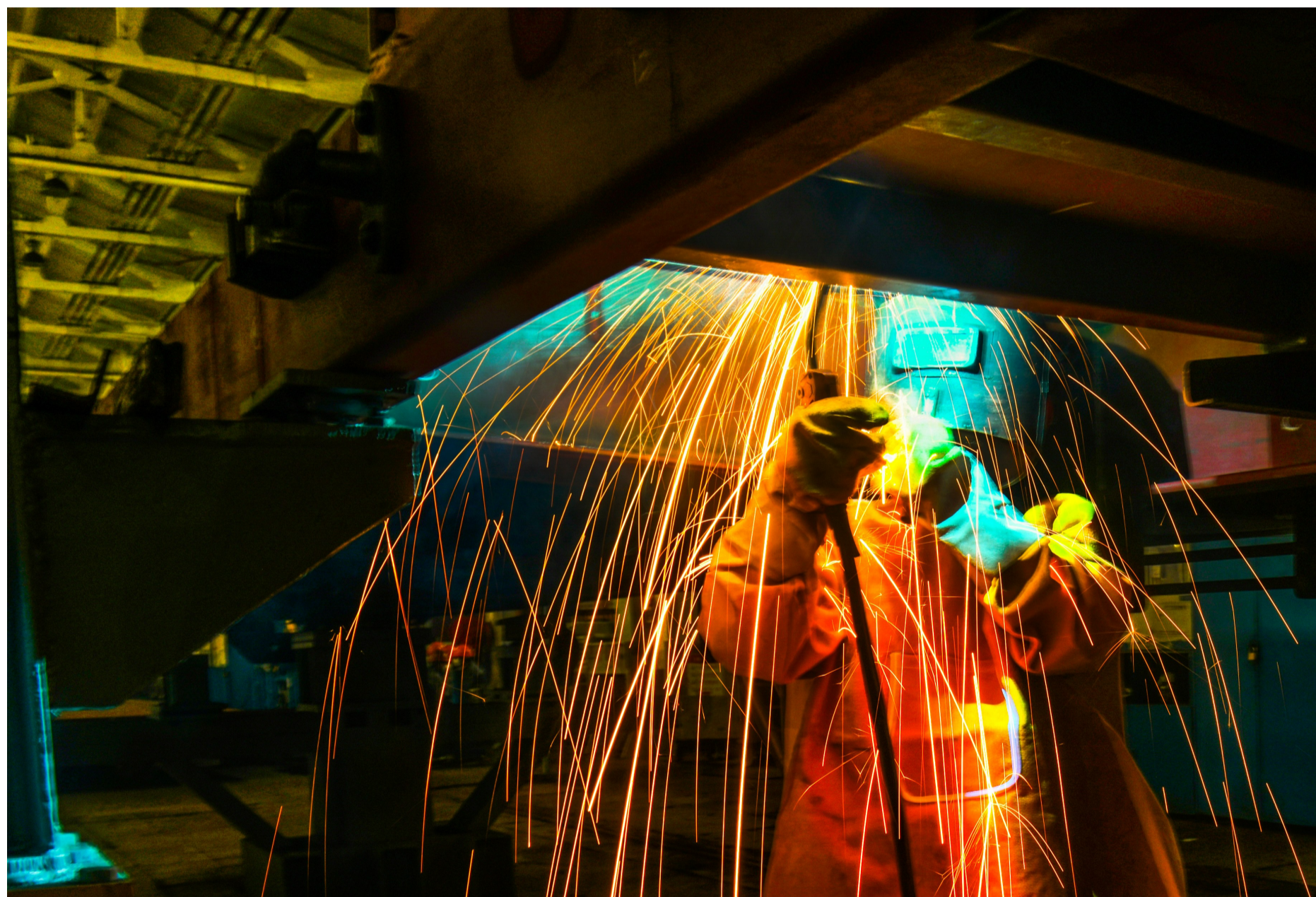
仰点焊接,身披彩带。