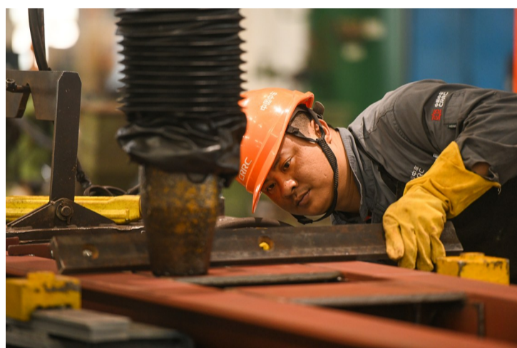
检测组焊质量,精益求精。