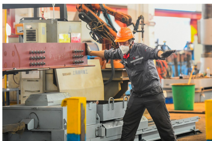
全神贯注吊运中梁。