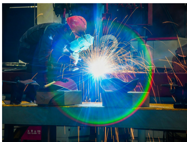
焊接现场,光晕闪闪。