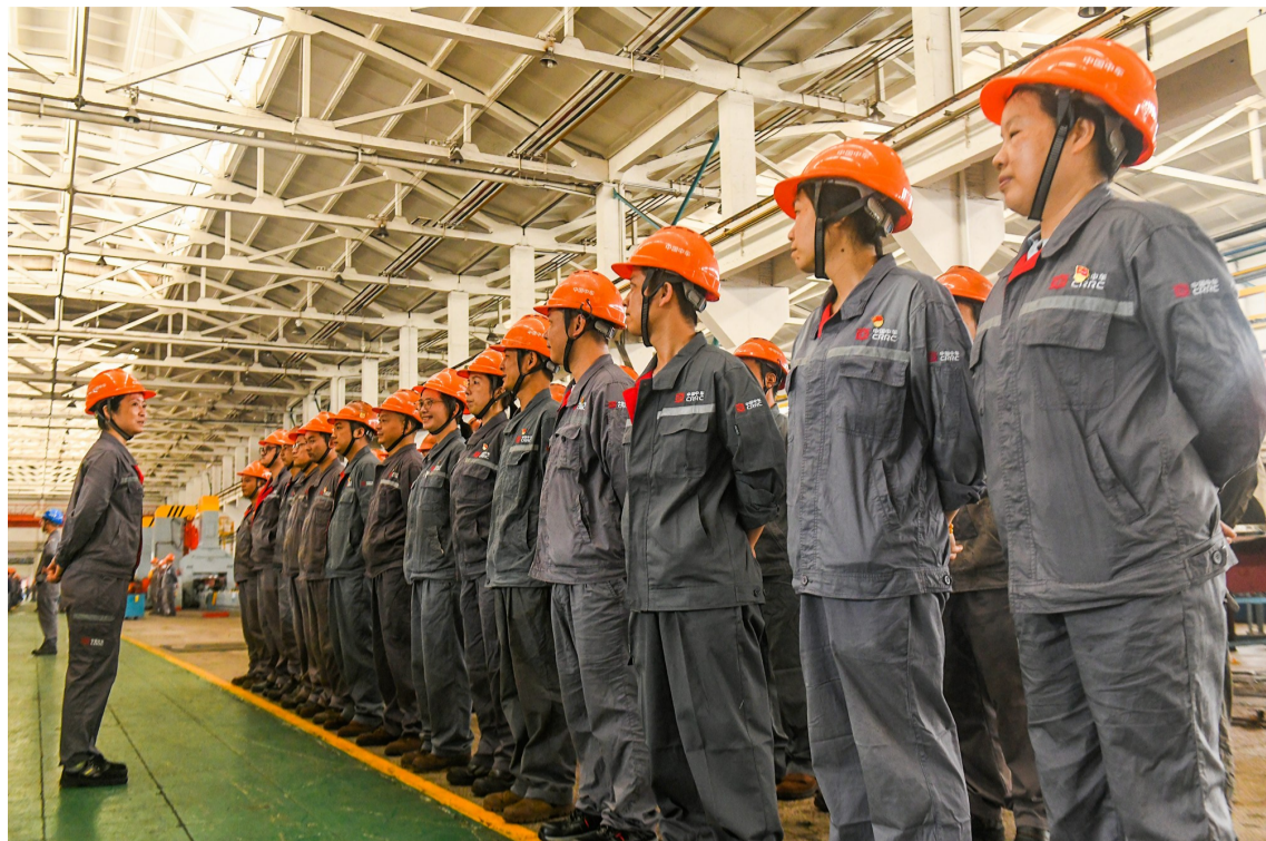
每天早上7点50分,“欧清莲”班的班前会。