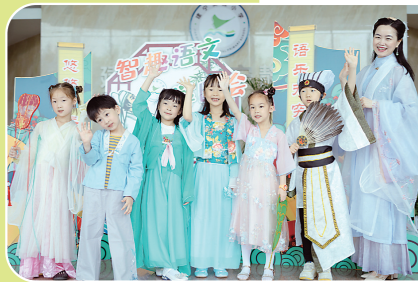
▲“智趣语文”游园活动现场。

市建宁实验小学语文节系列活动在快乐中结束，但是语文的种子，已经在孩子们稚嫩的心田生根发芽。