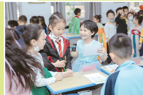
▲孩子们在游戏中体验快乐。