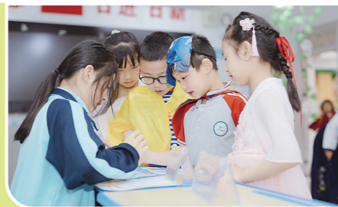
玩中思。 孩子们在玩中学