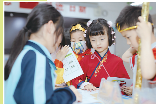
▲中学生担任评委。