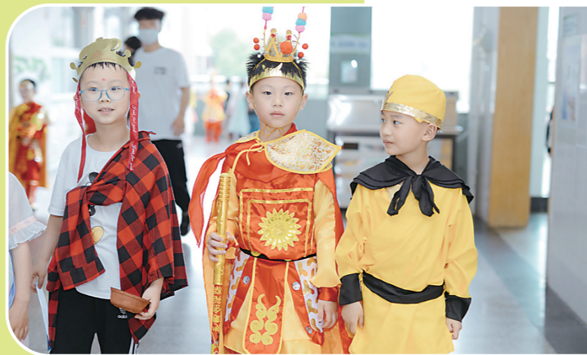
▲孩子们穿上了喜爱的服装。