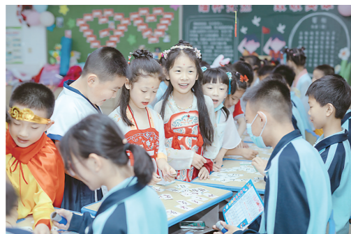
▲“遨游生字王国”游戏现场。 通讯员供图