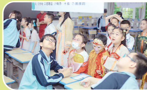
学生在猜灯谜。