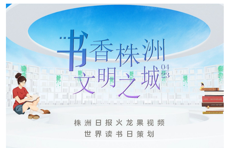
株洲日报·掌上株洲 世界读书日策划