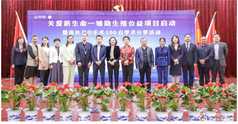
关爱新生命——辅助生殖公益项目启动暨海扶微创无创治疗一百台学术分享会现场。

株洲日报·掌上株洲讯(记者/刘琼 通讯员/顾言心) 4月22日,关爱新生命——辅助生殖公益项目启动暨海扶微创无创治疗一百台学术分享会,在市妇幼保健院举行。这标志着关爱新生命——辅助生殖公益项目落地株洲,众多不孕不育家庭将从中受益。