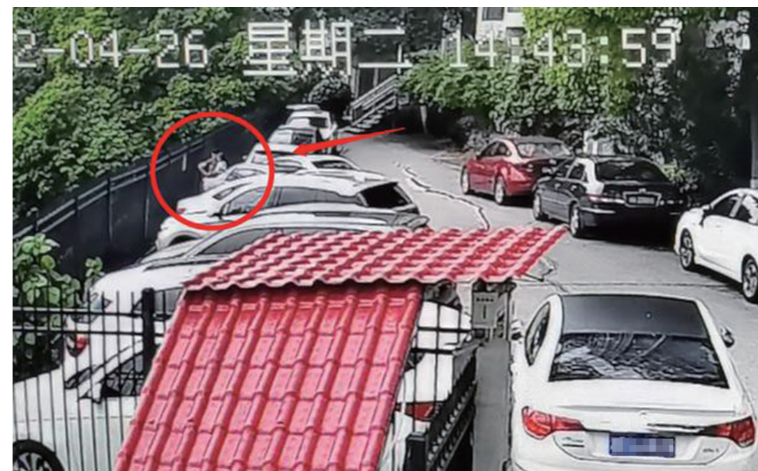
▲女子抱着小孩站在栅栏前(红圈处)。

4月26日下午2点44分,印象华都小区内道路发生坍塌,消防、交警、燃气、电力以及社区等部门到现场进行处理。