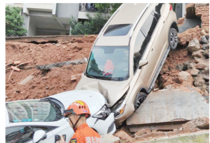
▲消防人员在现场施救。