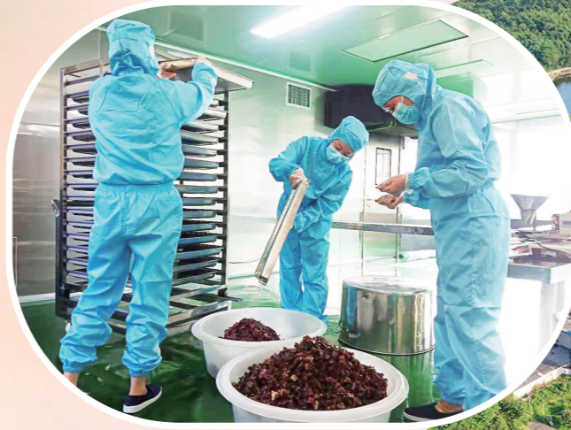
▲“沙坡里”生产车间。 ▲“沙坡里”全景图。图片均为通讯员提供

4月25日,位于株洲经开区云田镇的株洲市沙坡里农产品深加工有限公司(以下简称沙坡里)电商物流中心内,40多名工作人员正在忙碌打包发货,将各类腊制品发往全国各地。从传统的单一腊肉到各类腊制品,从门店销售到电商营销,从手工坊到全省农业产业化龙头企业、中国民族品牌,在打造“健康、安全、原生态、原滋味”的湖南特色美食道路上,沙坡里一路疾行,不断壮大。