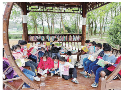
▲学生在“心愿亭”阅读。

本报讯(株洲晚报融媒体中心记者/谭筱 通讯员/肖喜林 刘慧)琅琅读书声,声声悦耳。4月21日,记者来到渌口区朱亭镇中心学校,还未进校门就已听到一阵阵阵读书声从教室里传来,悦耳动听。