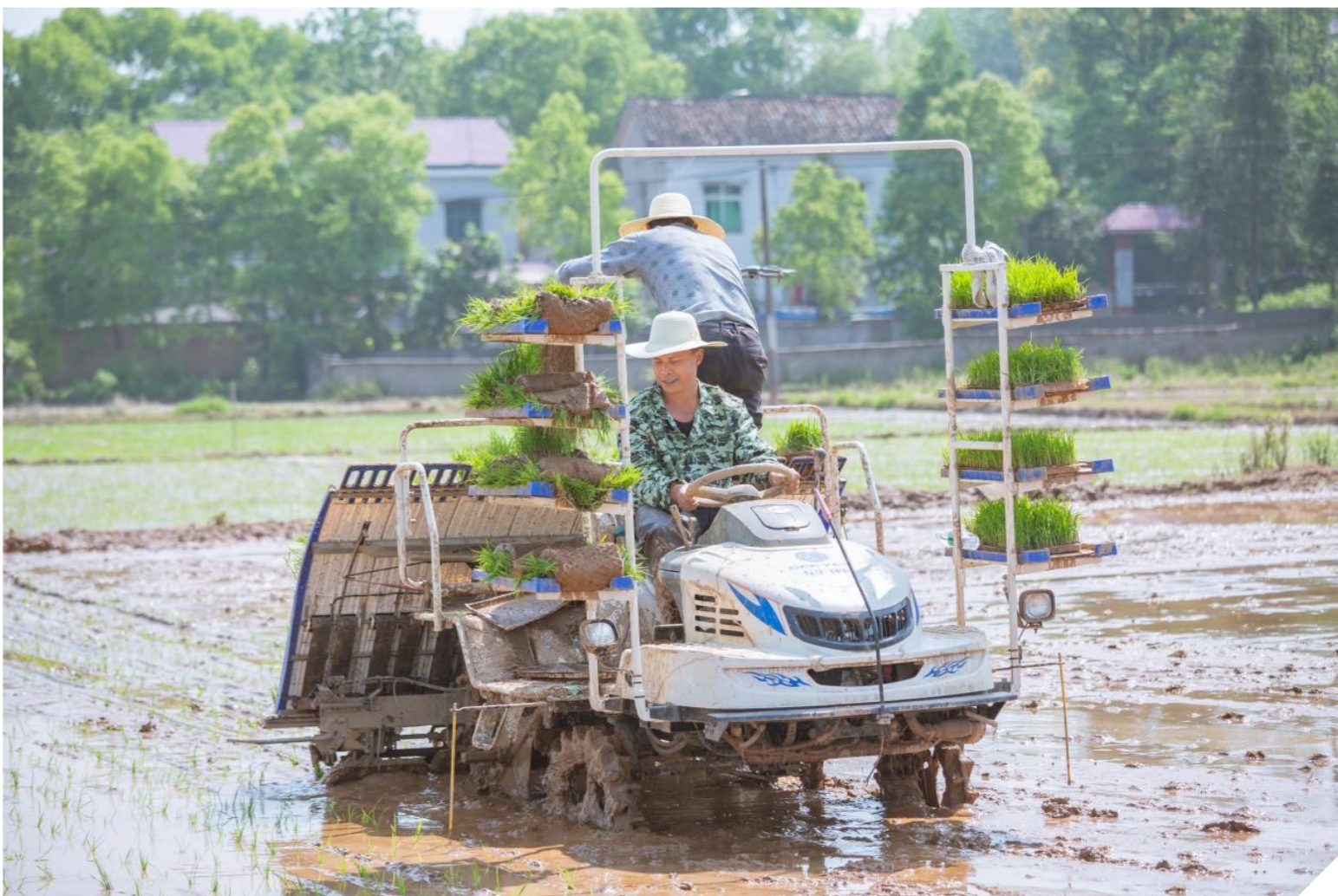
▲农谚有云，“谷雨时节种谷天”。4月20日，溆浦县南洲镇石板桥村的农田里，拖拉机、插秧机等现代化耕种机械来回穿梭，绘出一幅生机勃勃的“谷雨春耕图”。今年，该镇将6790亩早稻种植任务分解到村，并采取集中育秧的方式提高秧苗质量和育秧效率，为粮食稳产打下基础。