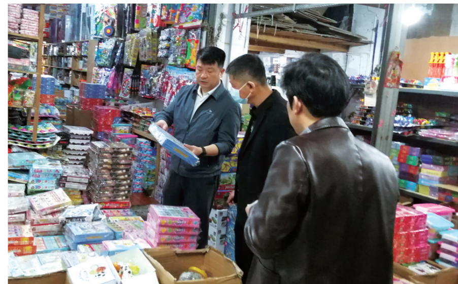
▲对校园周边商铺开展执法检查

中央广播电视总台“3·15”晚会曝光的产品质量相关问题，备受消费者关注。连日来，株洲市市场监督管理局迅速追踪社会关注热点问题，由市场监管执法支队牵头组织开展特别执法检查，对发现的问题从快从严处理，切实维护消费者合法权益。