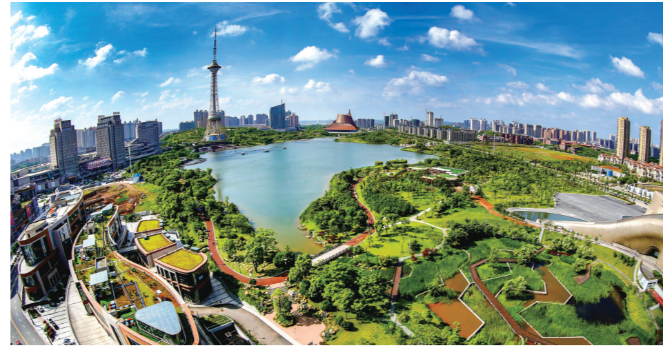
▲四月的神农湖，碧波荡漾，绿意环绕，在蓝天白云的映衬下美若画卷。