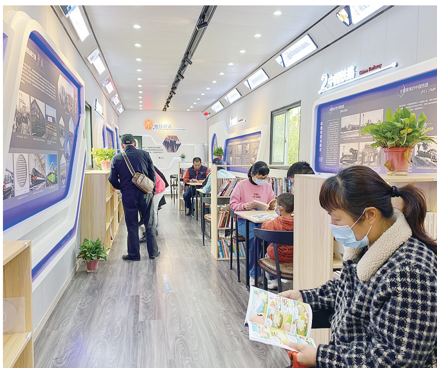
4月18日,居民在社区的微型博物馆和社区图书馆读书。