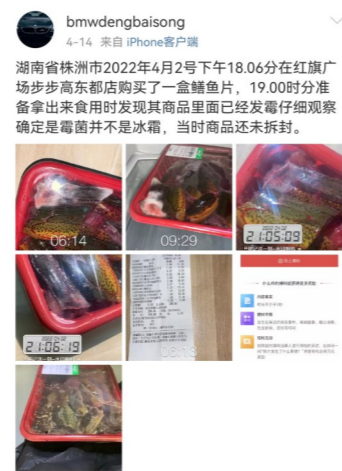
友善评论，文明发言

4月14日，微博博主“bmdwengbaisong”发布图文消息称，自己在步步高超市(东都店)购买了一盒鳊鱼片，仅过了一小时，当博主准备拿出来食用时，却发现商品已经霉变。该博主表示，当时商品并未拆封，经过仔细观察，确定疑似霉变部位不是冰霜而是发生了霉菌污染。