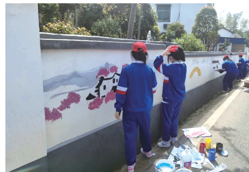
▲仙庠镇樟霞村公益墙绘活动中,株洲南雅学子为美丽乡村添色 资料图