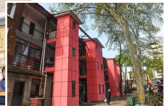
▲ 株化生活二区,红色建筑为新建的一户一厕。