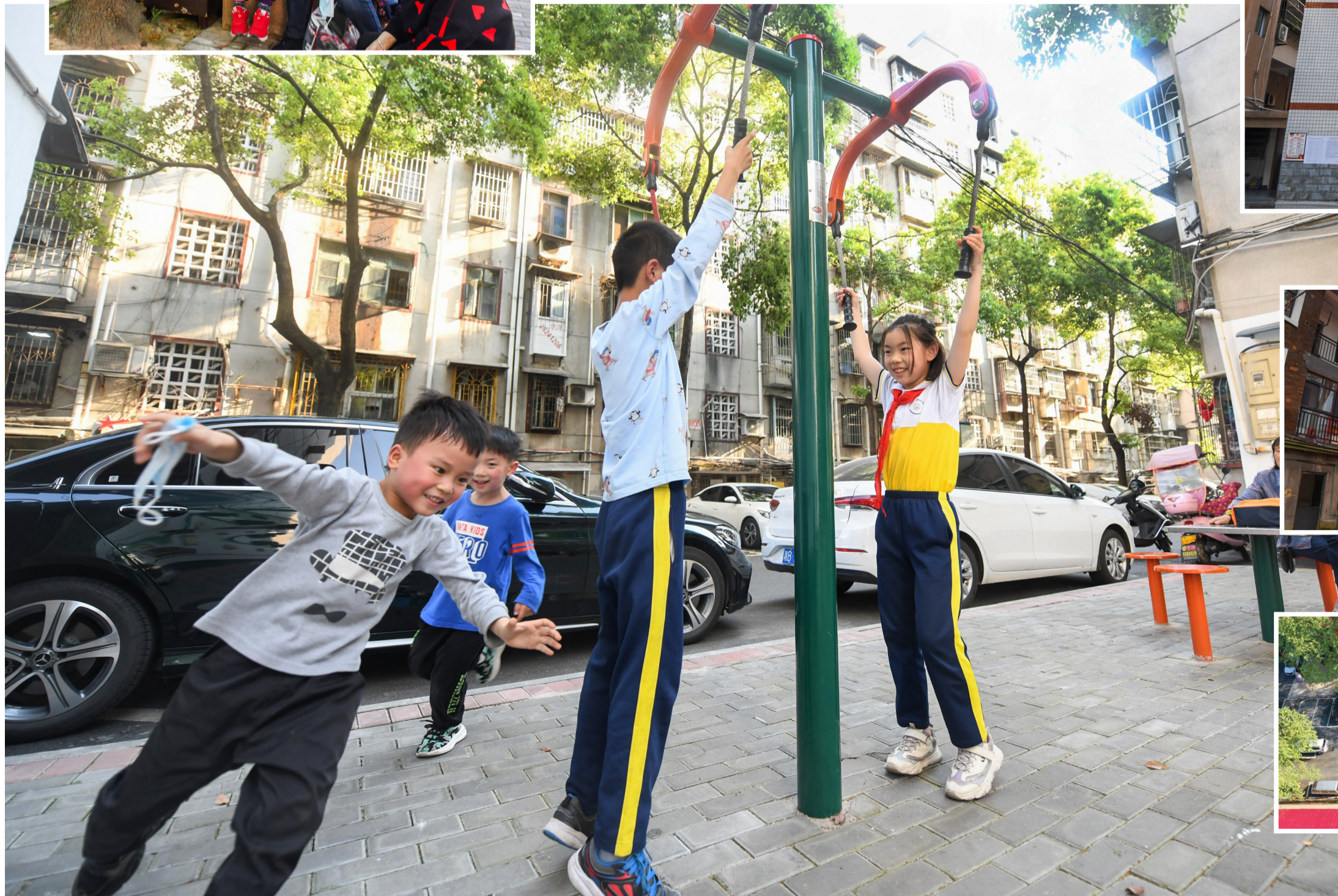
▲ 泰园社区,放学后的孩子们在休闲区快乐健身。