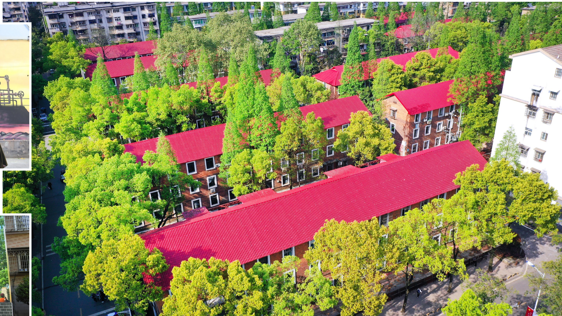
▲ 株化生活二区,红色的琉璃屋顶让小区颜值大增。