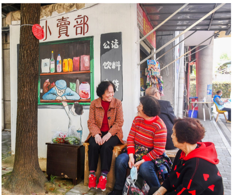
▼ 韶山路花园一村,居民们坐在小卖部前拉家常。

近3年,全市纳入国家城镇老旧小区改造项目596个,其中对343个小区实施排水管网改造,合计约134.77公里。今年全市城镇老旧小区改造项目214个,将改造老旧小区住房8987套,计划改造污水管网约61公里,涉及137个区。