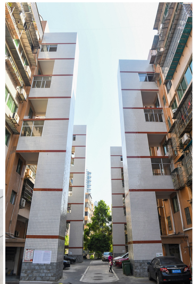
▲ 天元区银苑小区,新装的电梯。