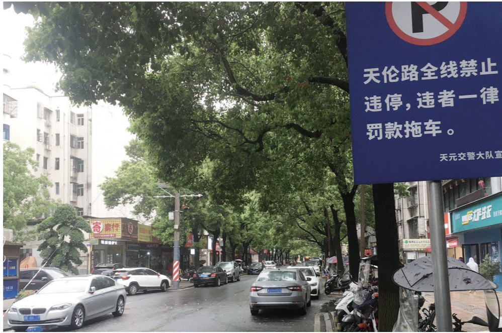
▲天伦路竖有禁止违停牌,违停车辆却“成群结队”。