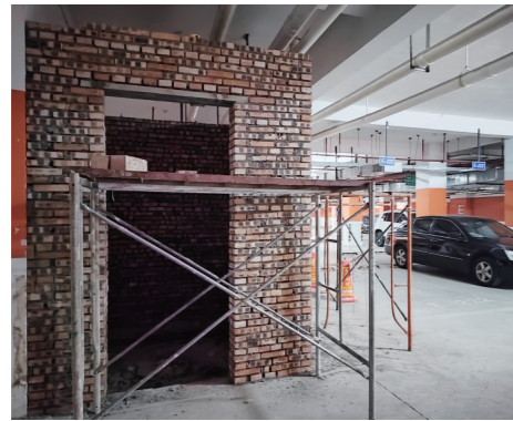
▲小区9栋地下车库,有人修建电梯间。

市住建局装饰办有关负责人则表示,“海天渔港”商铺欲将店内电梯与小区地下车库电梯相连,需取得该栋建筑物同等资质及以上施工设计单位的安全评估说明,并办理有关手续,方可作业。