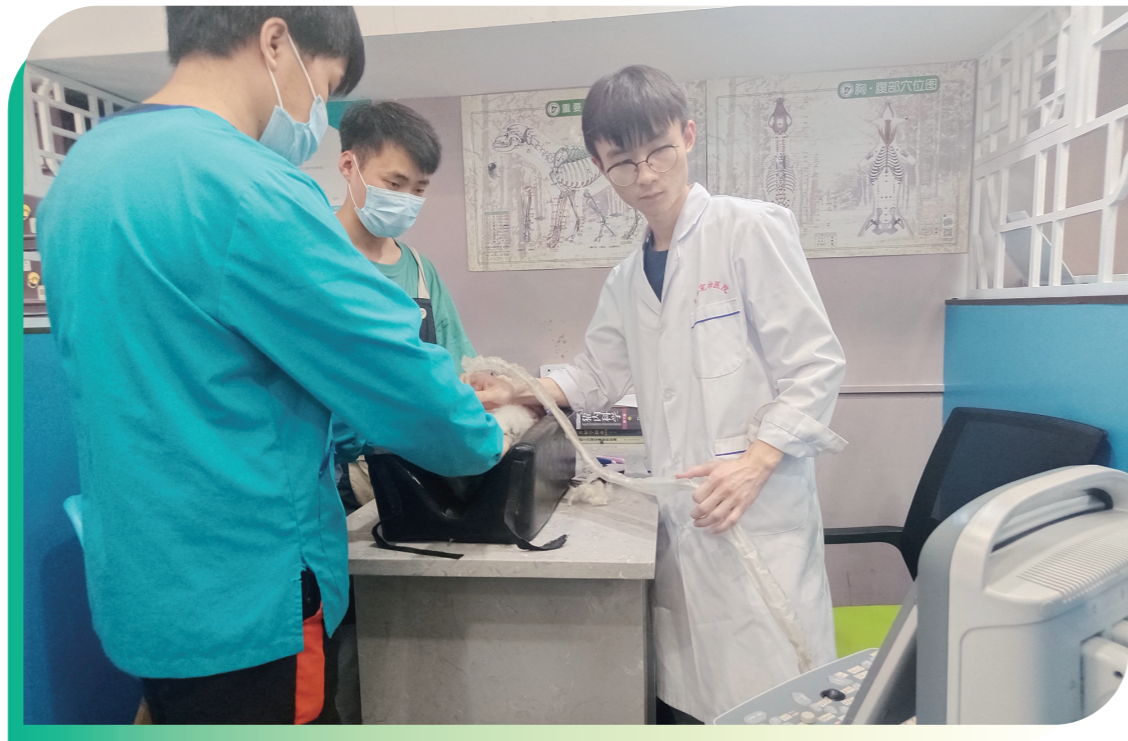
▲一只猫咪在宠物医院做B超。

记者了解到,宠物培训费用不客气。一个月3800元,一般培训学校会建议最少上两个月,也就是7600元,目前还处于高端教育。不过,业内人士预估,随着养宠人士越来越多,宠物教育必然发展为刚需。