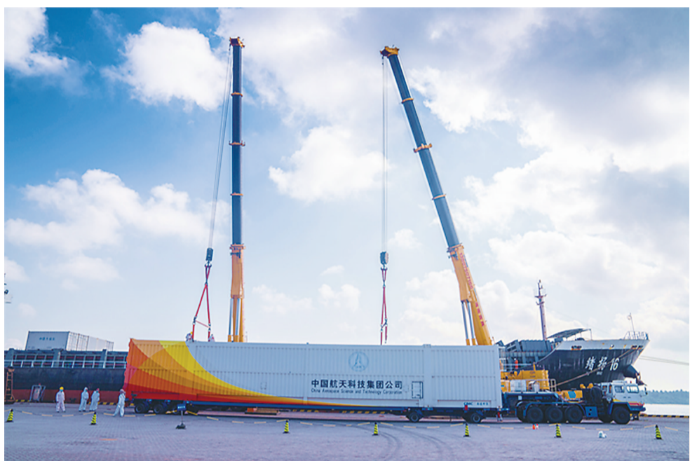
新华社海南文昌4月11日电 记者从中国载人航天工程办公室获悉，执行天舟四号货运飞船发射任务的长征七号遥五运载火箭已完成出厂前所有研制工作，于4月11日安全运抵文昌航天发射场。之后，长征七号遥五运载火箭将与先期已运抵的天舟四号货运飞船一起按计划开展发射场区总装和测试工作。目前，发射场设施设备状态良好，参试各系统正在有序开展各项任务准备。