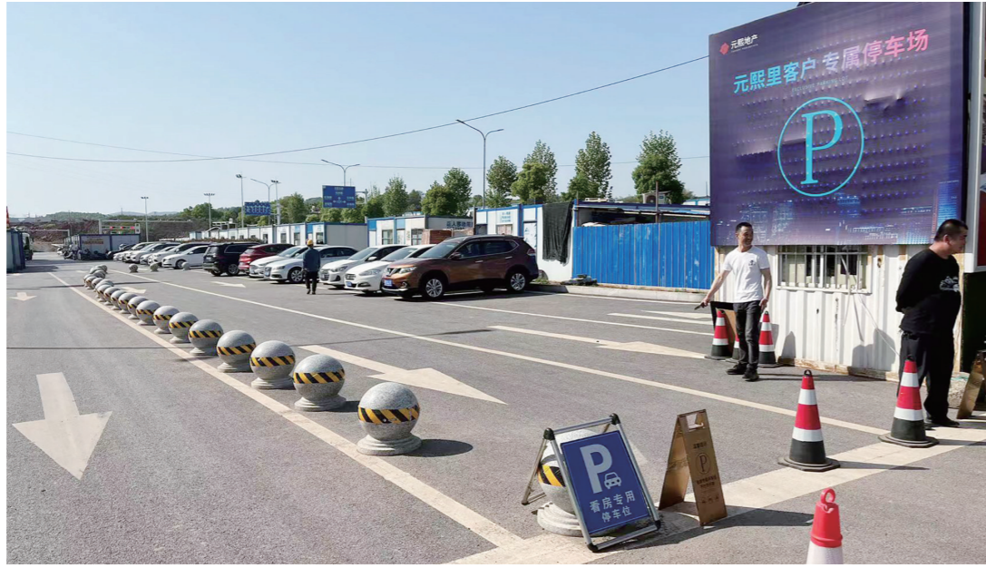
▲马路中,用石墩圈出的“专属停车场”。

本报讯(株洲晚报融媒体记者/贺天鸿)昨日,市民李先生拨打晚报新闻热线28829110反映,株洲经开区藏龙路的元熙里小区售楼部竟然在马路中间设置了一个停车场。 “在马路中间圈地,确实很离谱。”李先生表示,附近的道路大多都是最近一两年修建的,道路交通标识都已经施划好,但车流量并不大,因此很多车都会图方便停在路边。但是元熙里小区售楼部擅自圈地建“停车场”的行为却很罕见,对此他感觉不可思议。 记者前往李先生反映的区域发现,确实如李先生所说,该路段的一部分马路被石墩圈出了一块,附近赫然挂着一块“元熙里客户专属停车场”的告示牌,在石墩旁边也立着“看房专用停车位”的告示牌。 随后,记者前往元熙里小区售楼部发现,该售楼部门前有一块非常大的空地,甚至比马路中用石墩圈出的范围大好几倍,但没有停放任何车辆。 该售楼部接待记者的工作人员表示会联系相关负责人与记者接洽。记者在现场等了约半个小时,工作人员表示相关负责人无法到场。记者只好留下自己的联系方式,截至记者发稿时仍未收到任何回复。 售楼部占用大马路,相关执法部门为何视而不见?为此,记者向云龙交警大队反映了此事。云龙交警大队相关负责人表示,将尽快安排人员进行现场核实。