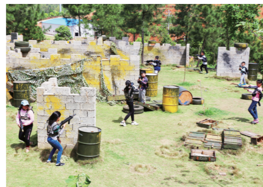
▲孩子们在玩真人CS,感受“战场”刺激。

本报讯(株洲晚报融媒体记者/杨凌凌 通讯员/安蓉)4月10日,走进芦淞区白关镇卦石村的华亿庄园,果香扑鼻而来,一颗颗圆润饱满的奶油草莓缀满枝头,让人垂涎欲滴。游客们拎着小篮子兴致满满地穿梭在大棚里,边采摘边品尝,享受着采摘带来的乐趣。 庄园的草莓采摘期一直持续到5月。每逢周末或节假日,面积近40亩、月销量约70000斤的草莓种植基地吸引了城区居民携家带口前来,一一试采摘。随着白关镇农村人居环境的持续改善,华亿庄园的缤纷美景、琳琅美食日渐扬名,这片“桃花源”也成了芦淞区乡村振兴的新名片。 “除了采摘草莓外,游客们可以在这里体验丛林穿越、传统射箭等野外拓展训练项目,感受农家生活的乐趣。”华亿庄园负责人说,近年来,采摘游越来越热,为了推进乡村振兴战略,庄园也在不断拓展内容,为游客带来更多新体验,让游客不再是“来了就摘,摘完就走”,而是真正地“游”起来。 近年来,芦淞区白关镇依托良好的生态环境和