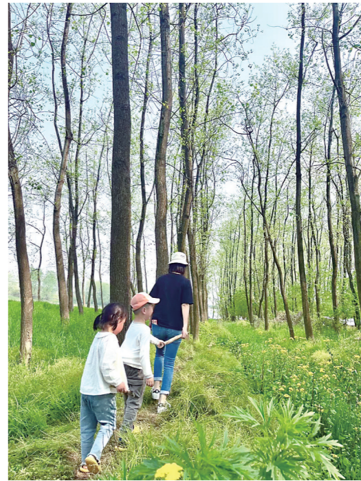
大手拉小手,一起找个有山有水有神的地方,把春天印在瞳孔里。