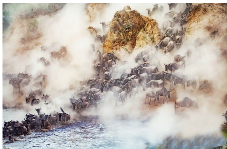
▲数万头牛羚渡河迁徙的壮观一幕。每年6月雨季过后，大批牛羚会从坦桑尼亚的塞伦盖蒂平原迁移至肯尼亚的马赛马拉，期间将历时两个多月，跨越近1800英里(约合2900公里)的艰苦路程。