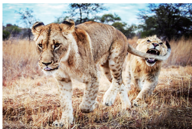
▲津巴布韦羚羊公园，一头淘气的狮子竟在背后偷袭一口咬住了同伴的尾巴。