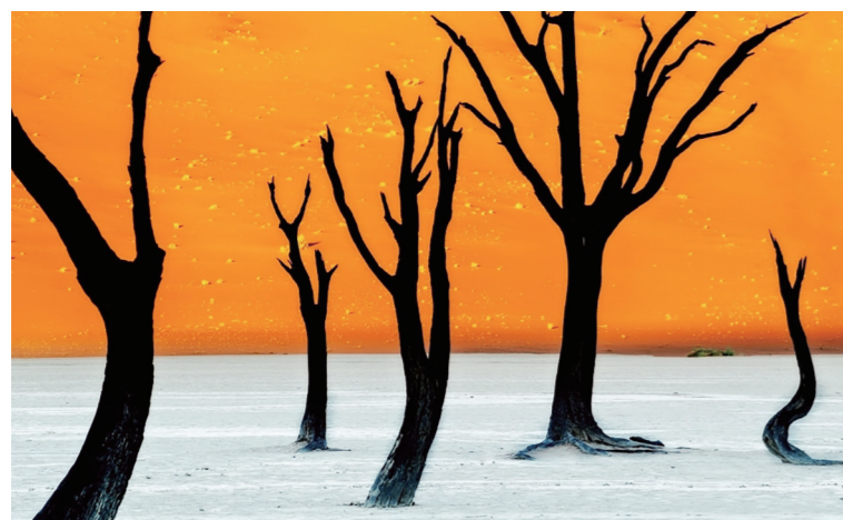
▲这是纳米比亚的纳米布·布克洛福国家公园。蔚蓝的天空下，橙色的沙丘，洁白的湖底，配以一棵棵枯木大树，“死亡之湖”的景色透出遗世独立的味道。