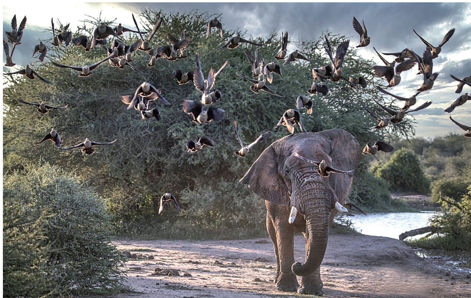
▲南非马蒂克维自然保护区，大象冲入鸟群，引发混乱，小鸟四散飞起。