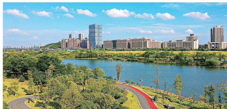
▶万丰湖风景区。

自河长制实施以来，我市结合万丰湖河湖连通生态水系景观工程，将水利建设、生态修复、河道治理、防洪工程与园林工程整体推进。项目总投资12亿元，总面积1.03平方公里，其中水域面积0.42平方公里，拥有湖心小岛、滨水码头、滨江步行道、青草广场、阳光沙滩、运动广场等景观，是一个集行洪排涝、工程景观、生态游憩、运动康体、滨水休闲、科普教育、红色文化等功能于一体的城市河湖型水利风景区。