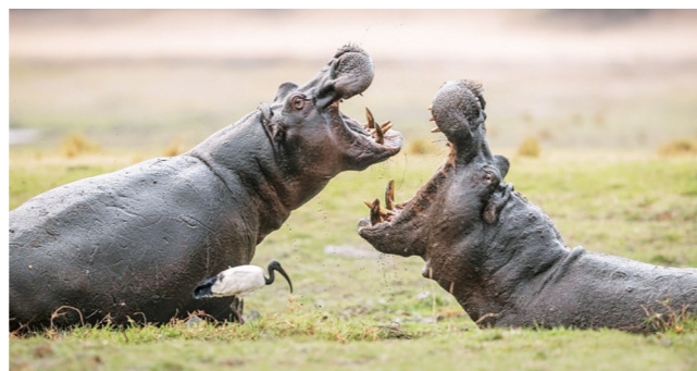
▲博茨瓦纳邱比河，河马准备与同伴战斗，张开自己的大嘴展示下颚的尺寸和力量。