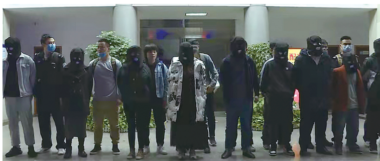
民警抓获部督“10·26”特大电诈跑分洗钱专案嫌疑人。