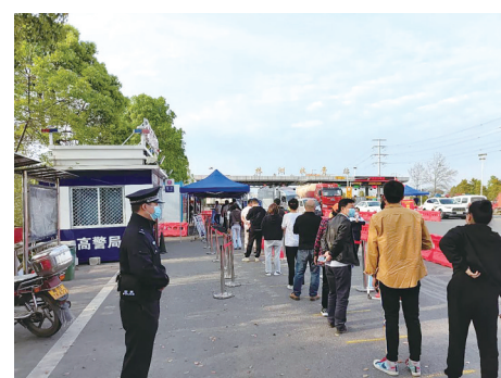
经开公安维护防疫卡口秩序。