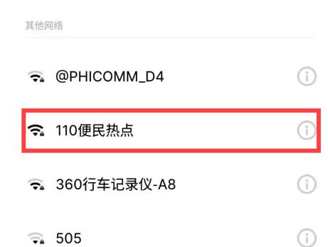
经开公安用手机流量生成“110便民热点”。