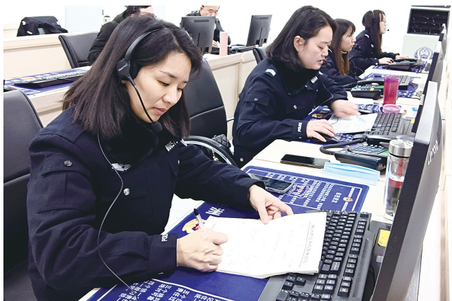
反诈民警通过电话劝阻电信诈骗对象。