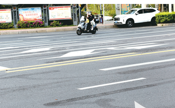
珠江北路左转车道