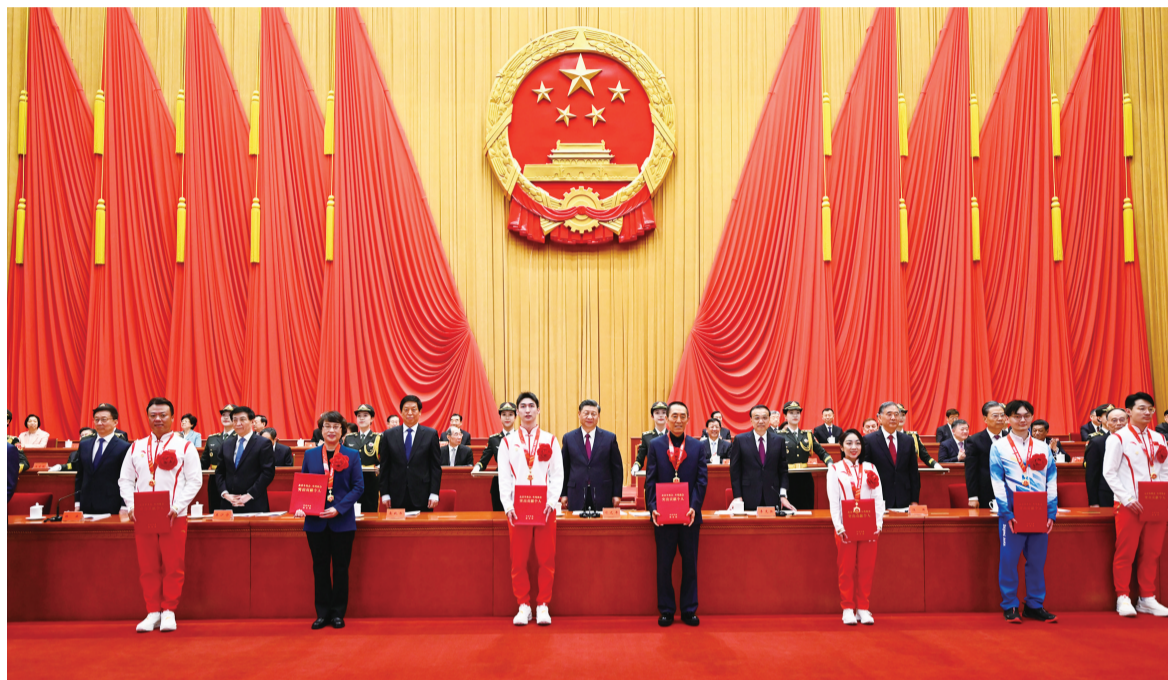
4月8日,北京冬奥会、冬残奥会总结表彰大会在北京人民大会堂隆重举行。习近平等为北京冬奥会、冬残奥会突出贡献个人和突出贡献集体代表颁奖。新华社记者 李学仁 摄

新华社北京4月8日电 北京冬奥会、冬残奥会总结表彰大会8日上午在人民大会堂隆重举行。中共中央总书记、国家主席、中央军委主席习近平出席大会并发表重要讲话。习近平强调,伟大的事业孕育伟大的精神,伟大的精神推进伟大的事业。北京冬奥会、冬残奥会广大参与者珍惜伟大时代赋予的机遇,在冬奥申办、筹办、举办的过程中,共同创造了北京冬奥精神。北京冬奥精神就是胸怀大局、自信开放、迎难而上、追求卓越、共创未来。我们要大力弘扬北京冬奥精神,以更加坚定的自信、更加坚决的勇气,向着实现第二个百年奋斗目标奋勇前进,向着实现中华民族伟大复兴的中国梦奋勇前进。