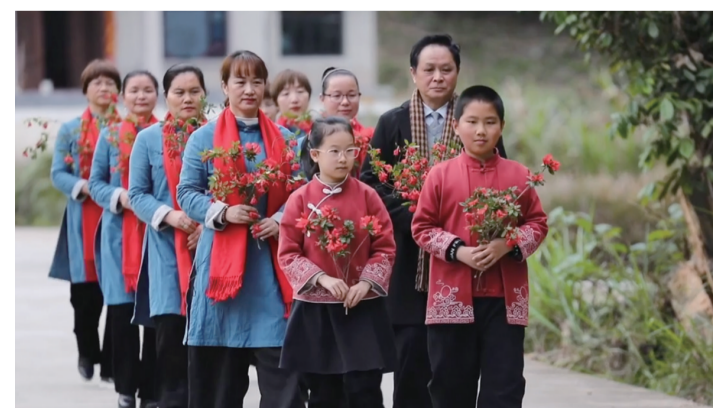
诗歌《盼燕归》朗诵现场。

山花烂漫诗言志,青山犹盼燕归来。清明时节,炎陵县创作诗歌《盼燕归》缅怀黄诗燕。黄诗燕,生前系株洲市政协副主席、炎陵县委书记。黄诗燕牺牲后,被追授为“时代楷模”、全国脱贫攻坚模范、全国脱贫攻坚先进个人、第八届全国道德模范、湖南省优秀共产党员等,并荣登“中国好人榜”“湖南好人榜”。