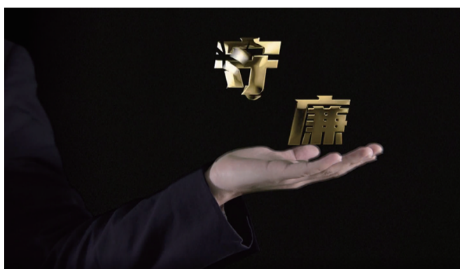
管好自己的双手,拒绝各种诱惑。