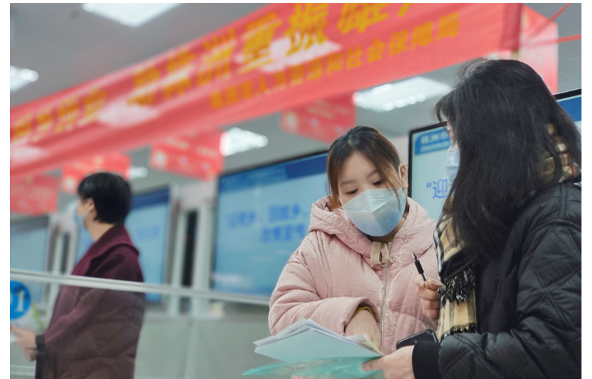
我市举行的“春风行动”招聘会和“迎老乡、回故乡、建家乡”服务台,市人社局工作人员在解答创业政策。(资料图)

株洲日报·掌上株洲讯(记者/何春林 通讯员/颜小波) 上个月,从事餐饮行业的覃艺面临市场、资金压力,遭遇了创业路上的“倒春寒”。让她惊喜的是,自己的一次网络留言,迎来了柳暗花明又一村的变化。