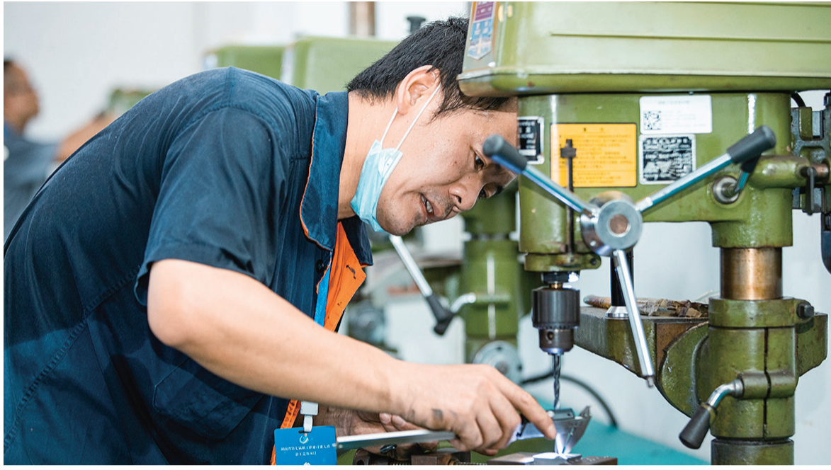
去年的全省职工技能竞赛现场,选手在认真比赛。