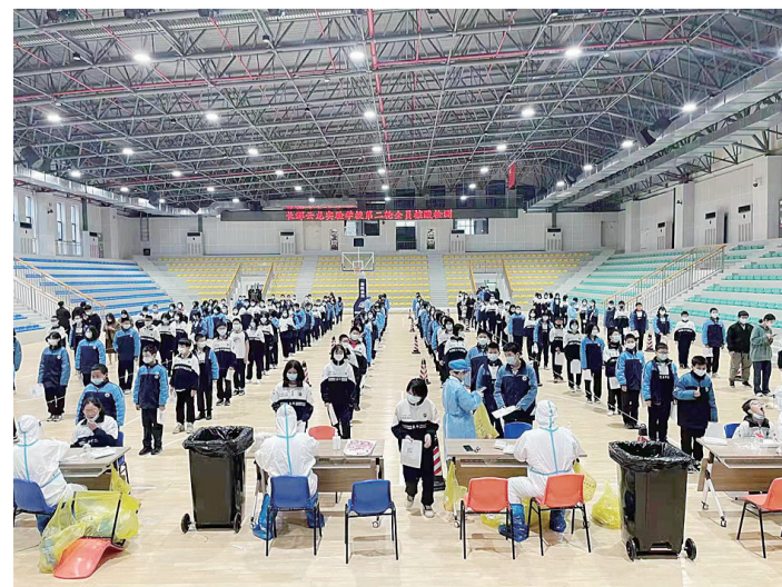
3月28日起,株洲经开区对辖区31所中小学、幼儿园进行第二轮全员核酸检测,共核酸采样14000余人。