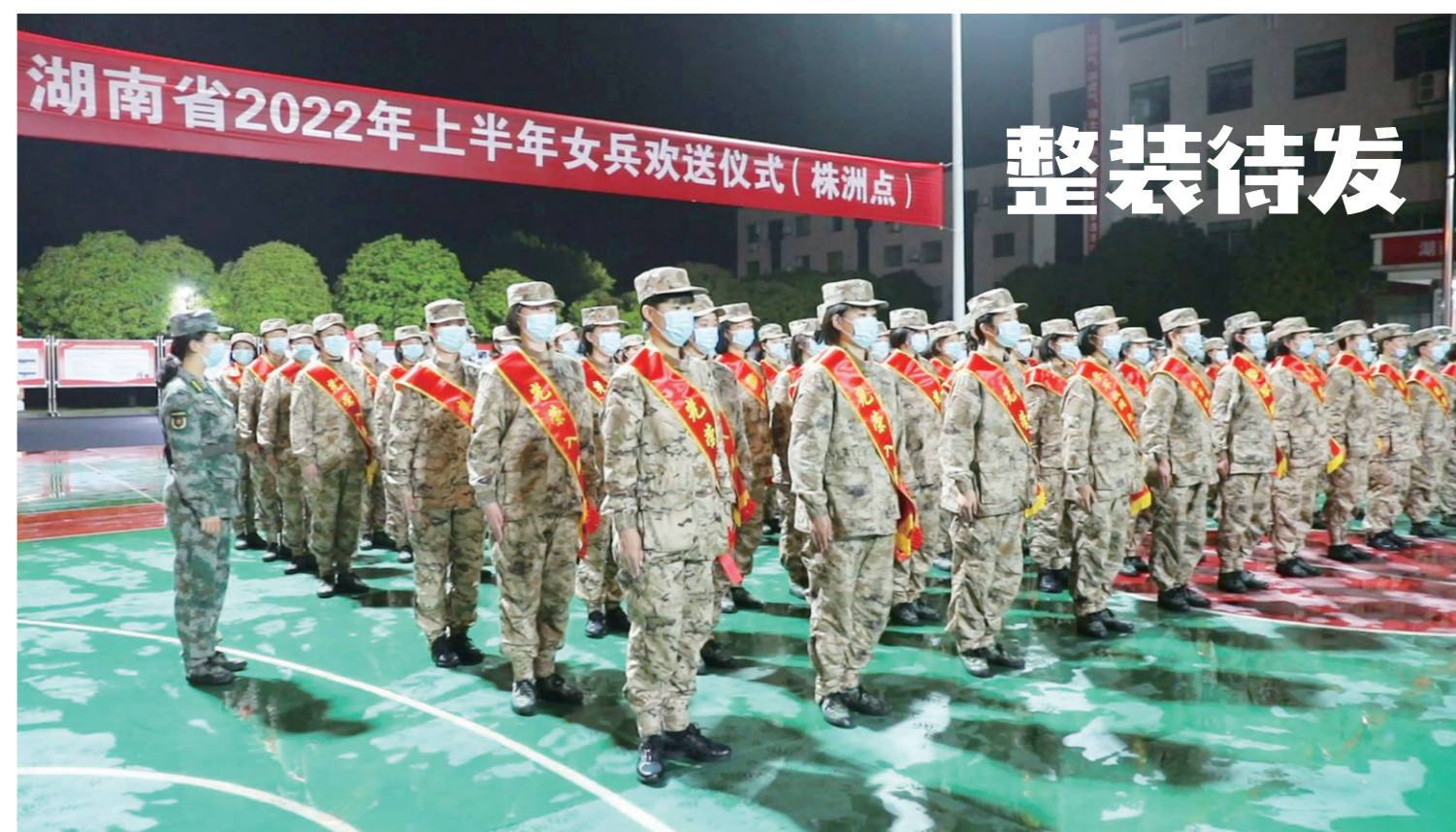
3月30日,全省8个州市的2022年春季女兵在株洲市民兵训练基地完成役前教育,开始分批奔赴军营。军分区首长、带训班长和工作人员纷纷用自己最朴实真挚的情感,为她们送上最美好的祝福。株洲军分区司令员张光华鼓励女兵们争做“政治合格、爱军精武、志向高远”的“花木兰”,为祖国和人民多立新功。图为欢送仪式现场。