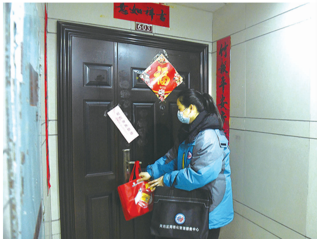
网格员为居家隔离人员送物资

“外地回来的小伙伴们注意了，回株要通过‘格防码’进行自主申报。”“请尽量避免参加密闭或通风条件不好的室内聚会和集体活动”……在株洲的街头巷尾随处可见网格员带着小喇叭，一遍遍播放着由街道宣讲员精心录制的“防疫播报”。这些移动的“小喇叭”成为了全市网格中最硬核的提醒和最温暖的陪伴。 新型冠状病毒感染的肺炎疫情防控战役打响后，我市2796名专兼职网格员身体力行，让小网格发挥疫情防控大作用，坚决筑牢疫情防控第一道防线，将疫情风险控制在社会治理最基础的网格中，实现了网格精细化管理和服务群众零距离，以社区“小网格”推动社会治理“大格局”。