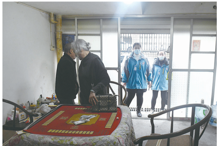
网格员在麻将馆劝导居民