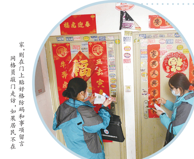
家，则在门上贴好格防码和事项留言，网格员敲门走访，如果居民不在

疫情大考考验一切。市域社会治理现代化部署推进以来，各地不断创新基层社会治理、提高公共应急能力、健全完善制度体系。而这些创新实践成果也在一次次“疫”战中得到了充分检验，发挥了关键性作用。 社区是疫情联防联控的第一线，也是外防输入、内防扩散最有效的防线。其重要性不言而喻，如何把这道防线筑牢，关键要把社区的各类资源和各种力量整合、调动起来。社区有数量庞大的基层干部，有驻区单位，有大量的商家企业，有各类社会组织，有星罗棋布的小区院落，有成千上万的流动人口。在疫情突如其来之时，如何在较短时间内做到社区人员信息摸排清、疫情防控到点控到位，需要基层党组织充分发挥战斗堡垒作用，需要党员干部发挥先锋模范作用，当好“守门员”“宣传员”“安全员”“防护员”“服务员”。 疫情防控阻击战是一场联防联控、群防群控、群防群治的总体战。社区作为疫情防控的主战场，不仅要整合调动各种资源力量，更要协调好各方面的资源力量。在上级领导部门和各级领导干部与社会力量下沉到社区之后，如何用好这些资源力量，极其考验社区的统筹协调能力和人员的调配，到物资的分配，从信息的畅通，到政策的宣传，既要做到一盘棋，也要抓重点。 社区治理是基层治理的基础，也是国家治理能力和治理水平的写照和真实反映。在急难险重中检验社区治理能力，总结经验，补足短板，才能让社区发展治理更加有力有序，才能让人民群众的生活更美好。