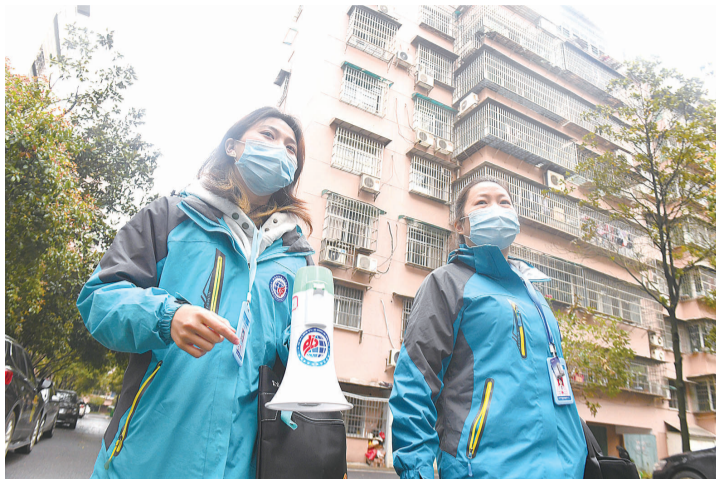
网格员带着小喇叭走街串巷