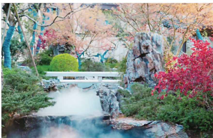
▲株洲建发央著园林实景图。

除了畅享国风好景,畅玩抖音神技外,本次大赛专门设置了四重国风豪礼,不止参赛业主可享,凡周末到访客户,也可整点抽福利赢大奖。 一重国风伴手礼——业主参与抖音比赛获赞18个,即可获国风碗具套装1份 二重点点抽福利——周末来访可参与定时抽奖,每日下午4点抽国风家电礼