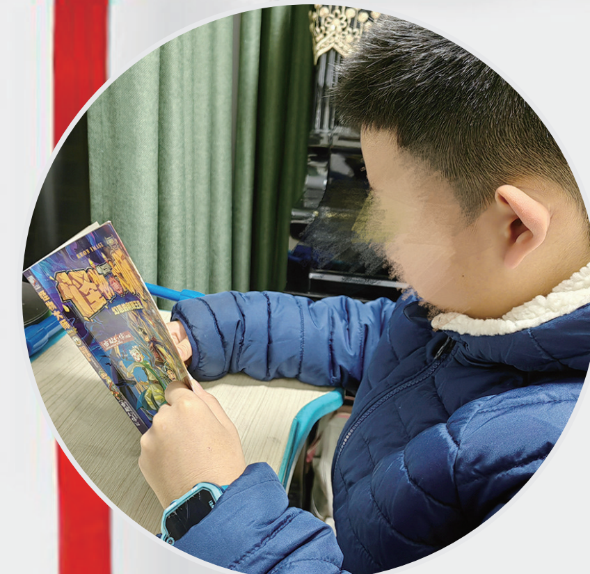
▲孩子的部分课外书里,有多个暴力、恐怖情节。