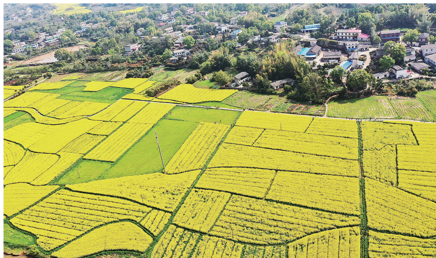
▲近日,荷塘区仙庾镇徐家塘村,千亩油菜花开始绽放,大地一片金黄,与民居、远山融为一体,构成一幅画卷般的乡村美景。据村民介绍,油菜花大规模开花是在三月中下旬至四月上旬。