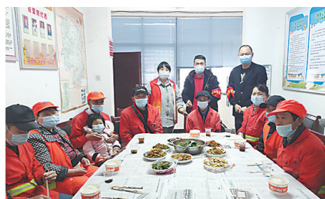
▲环卫工人享用“爱心午餐”。

本报讯(株洲晚报融媒体记者/杨凌凌 通讯员/宁翔)3月23日上午12时,芦淞区建宁街道堤升街社区会议室格外热闹。身穿橘黄色制服的环卫工人三五成群地围坐在桌前,谈笑间脸上洋溢出幸福的微笑。10余名环卫工人在这里享用了热乎乎的“爱心午餐”,感受到来自社区以及爱心人士的关注与温暖。